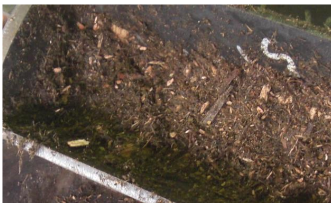
<取扱物例（木質チップ）>