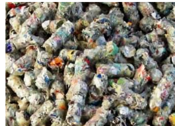
RPF(プラスチック燃料)